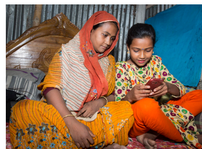
Una adolescente muestra a su madre cómo llamar al "109", el número de la "Línea de prevención del matrimonio infantil" en Bangladesh.

Si desarrollan investigaciones en materia de MUITF, nos encantaría conocerlas. Envíen un breve resumen de su investigación para incluirlo en nuestro rastreador y suscribanse a la lista de correo de la red CRANK.