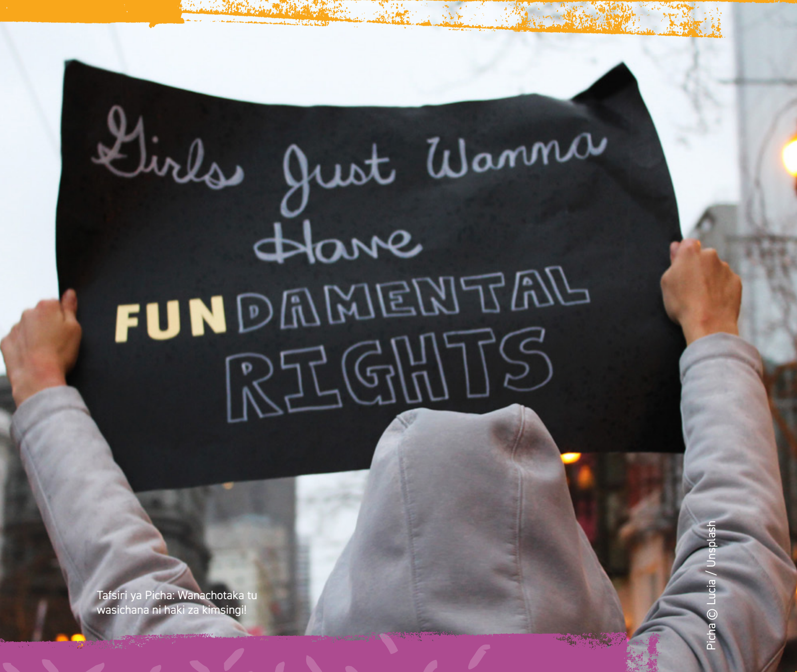
Tafsiri ya Picha: Wanachotaka tu wasichana ni haki za kimsingi!