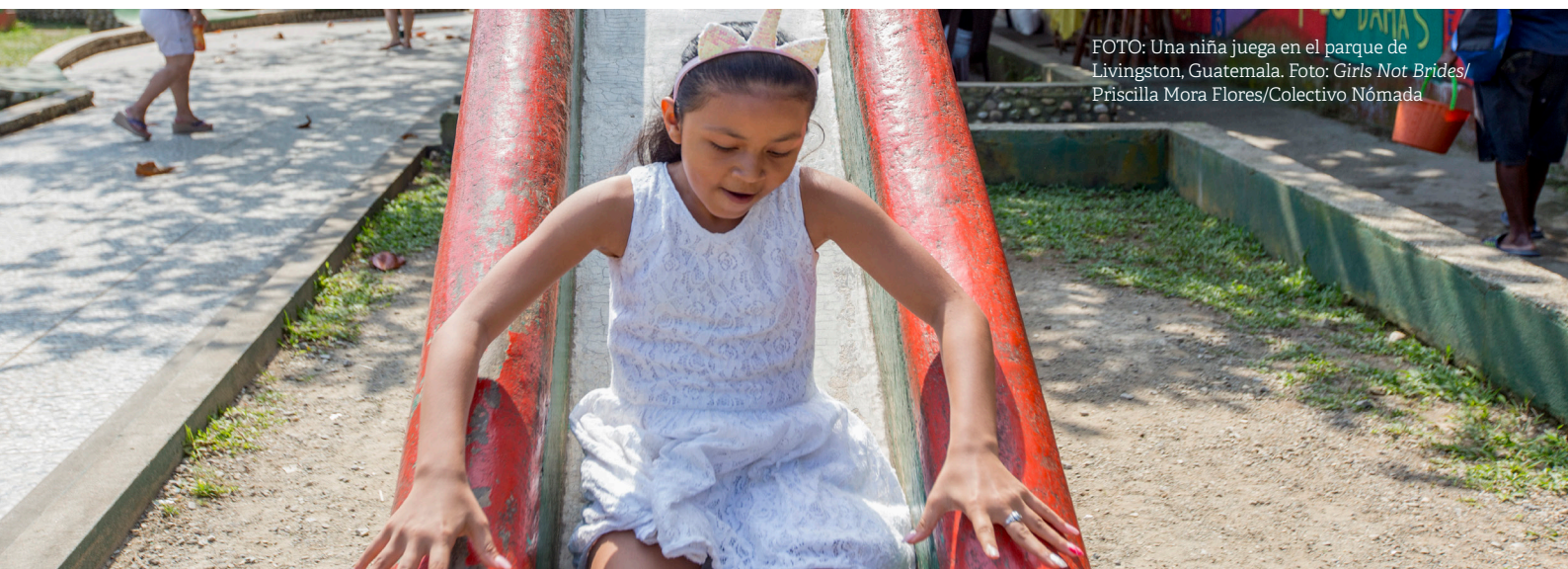
FOTO: Una niña juega en el parque de Livingston, Guatemala.

Como parte de un enfoque integral, la protección social –en especial, los programas de transferencias de efectivo– puede ayudar a mitigar las causas económicas y sociales de los matrimonios y las uniones infantiles, tempranas y forzadas (MUITF). a Este informe temático b sirve como guía para que las personas responsables de la elaboración de políticas, profesionales y activistas puedan garantizar que los programas de transferencias de efectivo contribuyan al abordaje de los MUITF en todo el mundo.