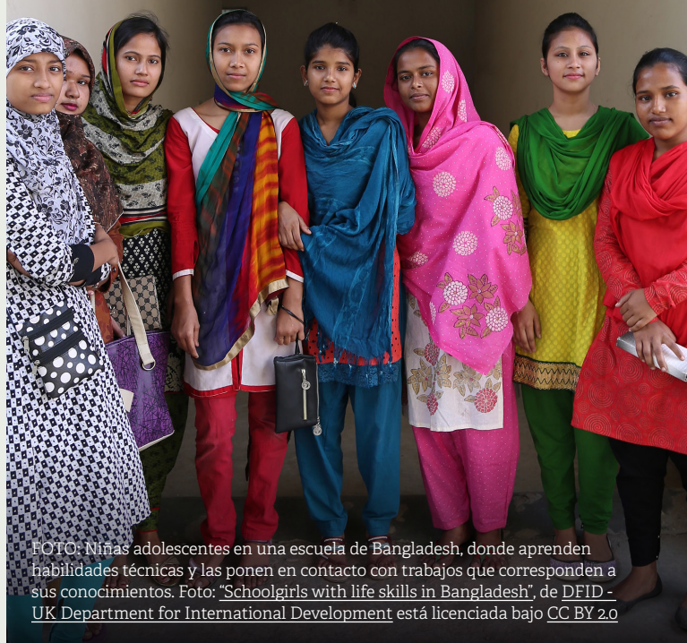
FOTO: Niñas adolescentes en una escuela de Bangladesh, donde aprenden habilidades técnicas y las ponen en contacto con trabajos que corresponden a sus conocimientos.